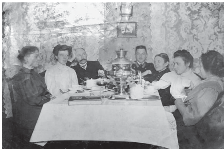
Рис. 2. Н.А. Семашко с родственниками 8 .